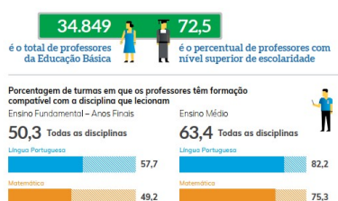
Tabela 7: Formação compatível com a disciplina que leciona.