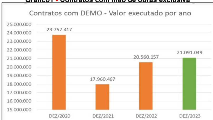
Gráfico1 - Contratos com mão de obras exclusiva

Os dados contratuais representados nos gráficos 1 e 2 especificam dois conjuntos: contratos com Dedicção Exclusiva de Mão de Obra (DEMO) e contratos sem Dedicção Exclusiva de Mão de Obra (Demo). O total dessas despesas repercute um montante descoberto - passivo contratual - de 2023 a se somar a outras dívidas de exercícios anteriores. O cômputo desse passivo deixa a Ufal em situação que compromete o funcionamento de 2024.