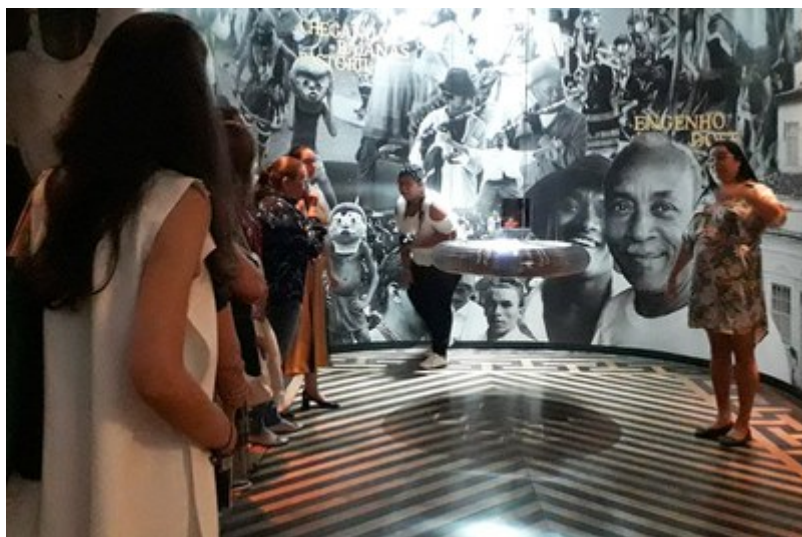
Participantes do Forproex em visita ao MTB

Por: Jacqueline Batista – jornalista e Pei Shung Fon - estudante de Relações Públicas - 22/04/2019 às 11h44 - Atualizado em 22/04/2019 às 11h45