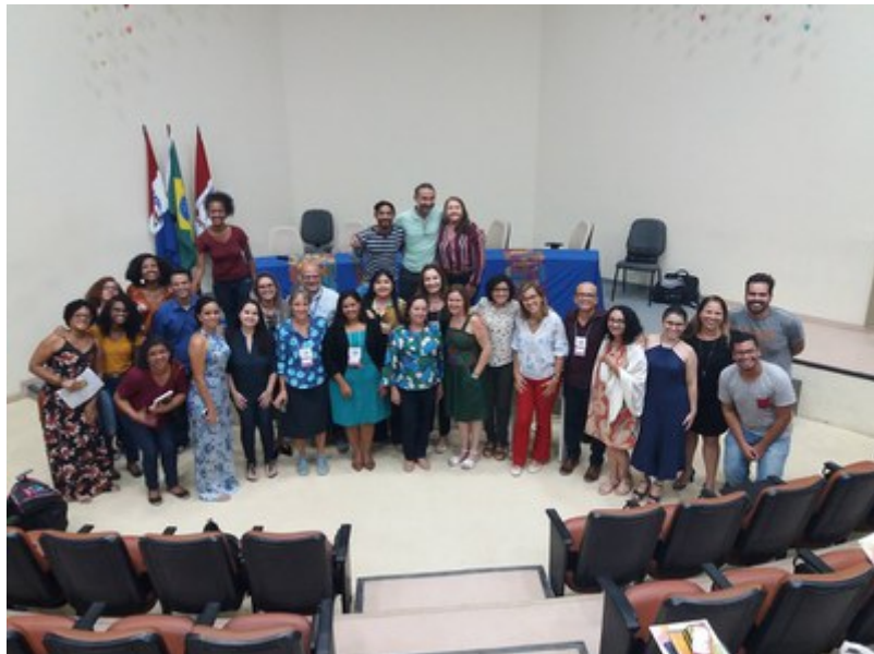
Participantes do Forproex Nordeste 2019

Por: Paulo Canuto - estudante de Jornalismo - 07/05/2019 às 09h40 - Atualizado em 07/05/2019 às 09h40